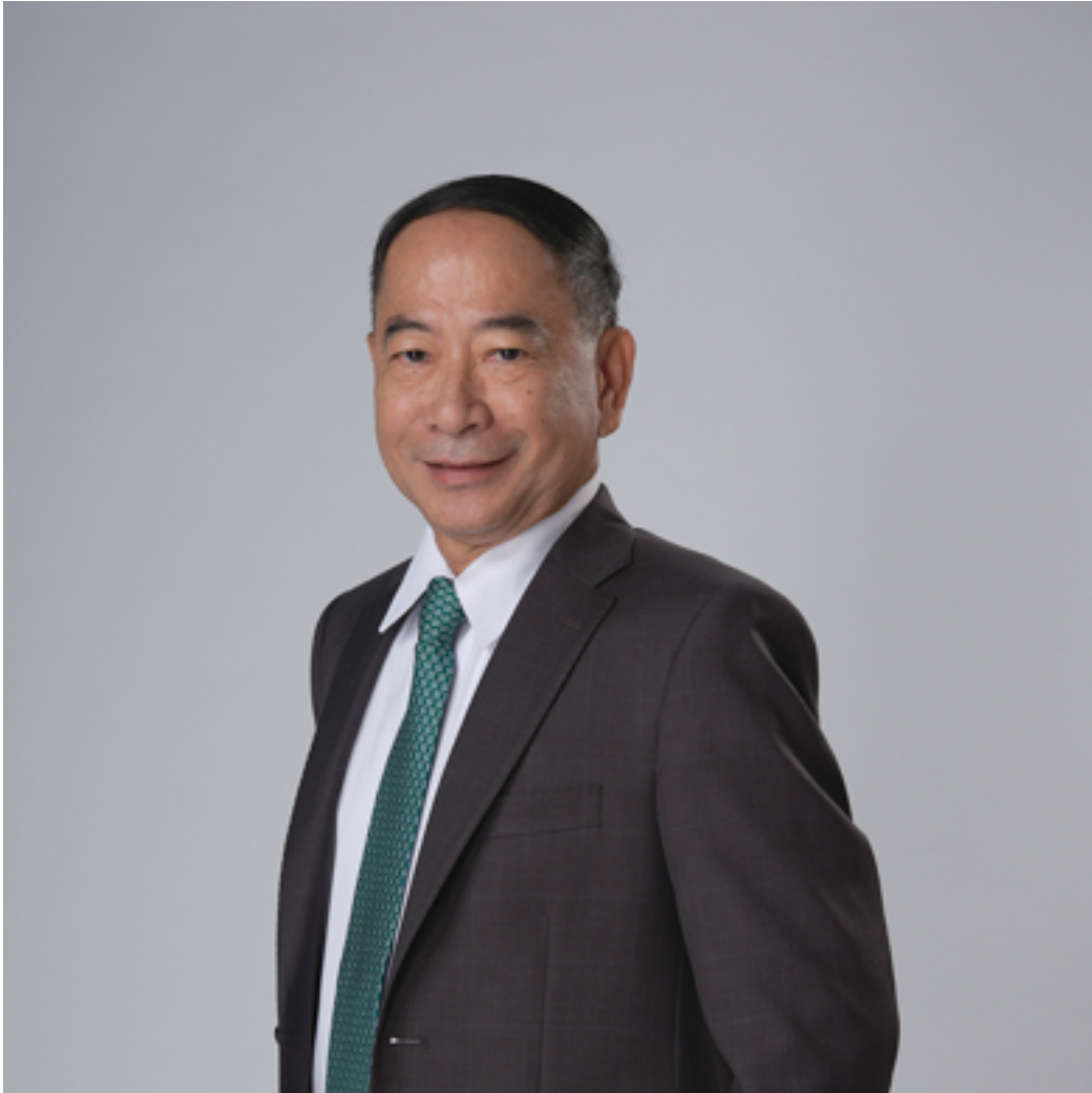
ประธานกรรมการบริษัท